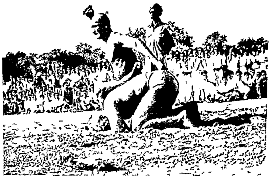
Fig 5 Vajramuṣṭi Wrestling End